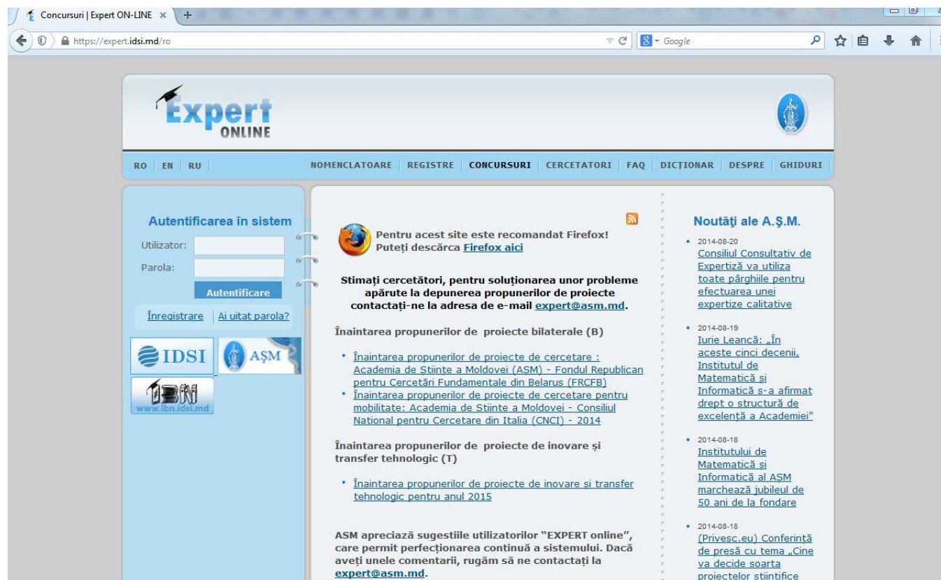
Fig. 1. Pagina principală a sistemului EXPERT online

Instalați acest navigator web pe calculator, urmând instrucțiunile pe http://www.mozilla-europe.org/en/firefox/ .