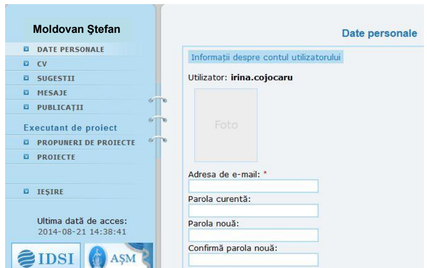
Fig. 4. Interfața de modificare a parolei de acces

Pentru modificarea parolei selectați din meniu opțiunea Date personale , după care completați câmpurile cu informația solicitată: Parola curentă , Parola nouă și Confirmă parola nouă .