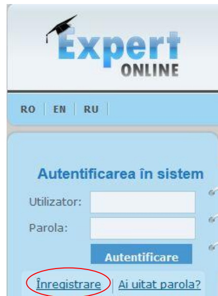
Fig. 2. Interfața de autentificare în EXPERT online

Important! La solicitarea rolului Expert independent , în dreptul opțiunii este afișat „Spre validare”. Simultan Managerul CCE primește un mesaj de notificare și validează sau refuză validarea rolului de Expert independent .